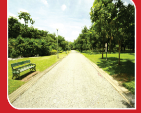
संपूर्ण ले-आऊट मध्ये डांबरी रस्ते